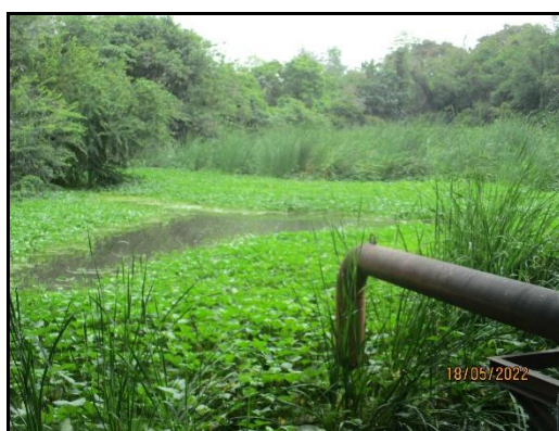
ภาพที่ 2.7 ป่อน้ำหม้อบดซีเมนต์ขนาด 12,600 ลบ.ม.