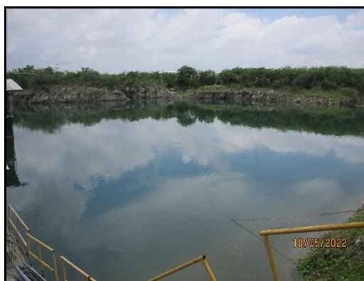
ภาพที่ 2.8 ป่อซับบอน ขนาด 906,200 ลบ.ม.