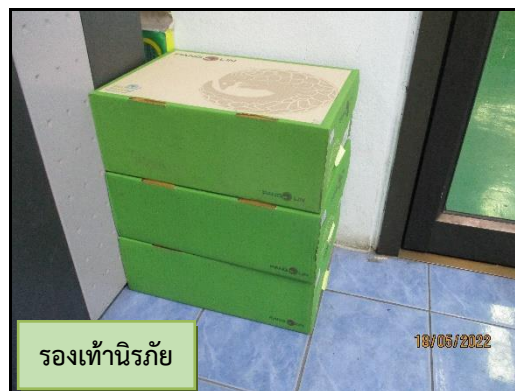
รองเท้านิรภัย