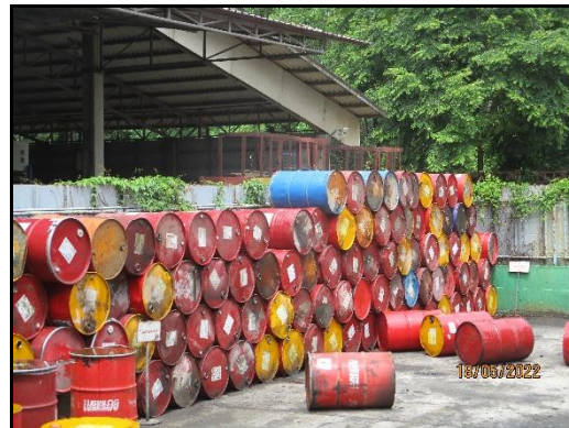
ภาพที่ 2.19 บริเวณพื้นที่ถังเก็บน้ำมันหล่อลื่นขนาด 200 ลิตร พร้อมฝาปิดมิดชิด