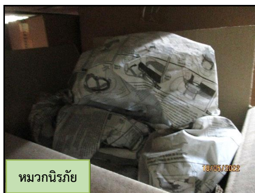
หมวกนิรภัย