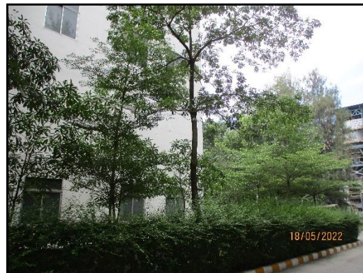
ภาพที่ 2.22 การปลูกต้นไม้และพื้นที่สีเขียวภายในโรงงาน