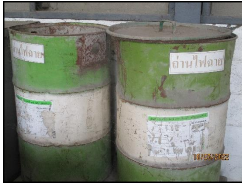
ภาพที่ 2.17 ถ่านไฟฉายที่ใช้แล้วบรรจุใส่ถัง 200 ลิตร