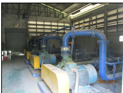
ภาพที่ 2.3 บ่อบาดาลดินโนน ขนาด 2,000 ลบ.ม.