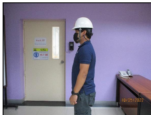
ภาพที่ 2.14 พนักงานสวมใส่อุปกรณ์ป้องกันอันตรายส่วนบุคคล