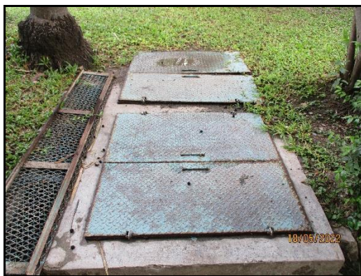
ภาพที่ 2.9 ป่อเกรอะ-ป่อซึม สำหรับบำบัดน้ำทิ้งจากสำนักงาน