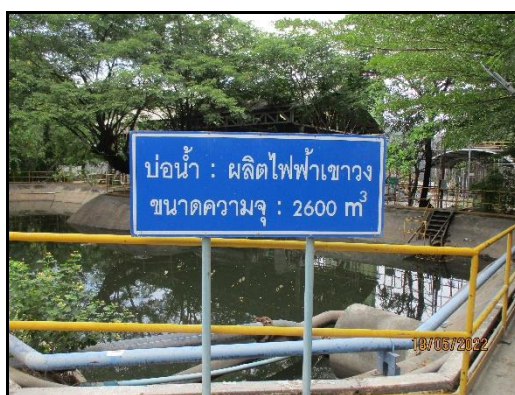
ภาพที่ 2.11 บ่อพักน้ำเสียภายในพื้นที่โครงการปรับปรุงและเพิ่มประสิทธิภาพการใช้พลังงานฯ