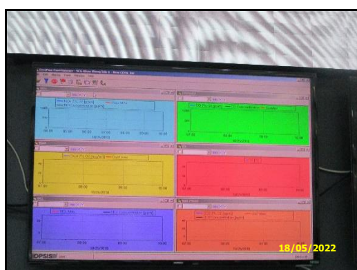
ภาพที่ 2.2 จอแสดงผลการติดตั้งเครื่องตรวจวัดฝุ่นที่ระบายออกจากปล่องหม้อเผา (CEMs) เพื่อการควบคุมปริมาณฝุ่นให้อยู่ในเกณฑ์ที่กำหนด ภายในห้องควบคุมการผลิต