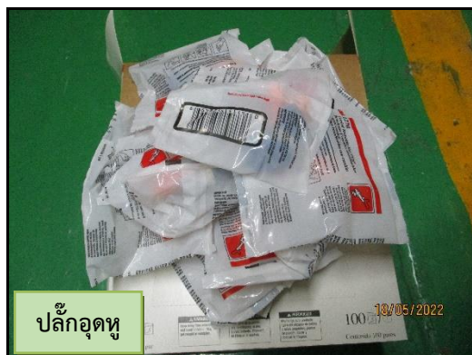
ปลั๊กอุดหู