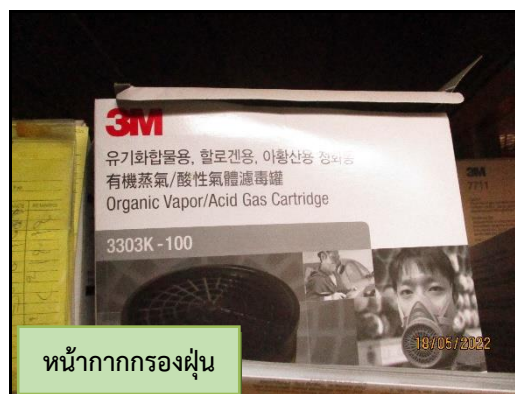
หน้ากากกรองฝุ่น