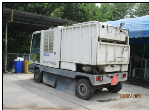
ภาพที่ 2.20 รถดูดฝุ่นประจำโรงงาน