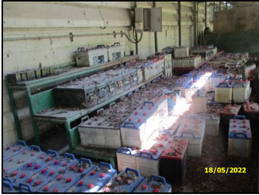
ภาพที่ 2.16 อาคารเก็บแบตเตอรี่ที่ใช้แล้ว