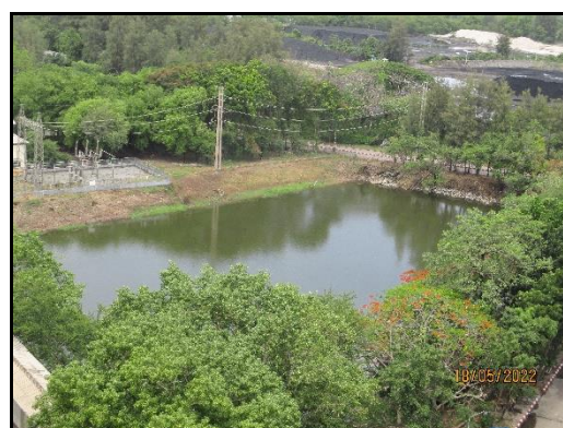
ภาพที่ 2.4 บ่อน้ำซีเมนต์ขาว ขนาด 75,000 ลบ.ม.