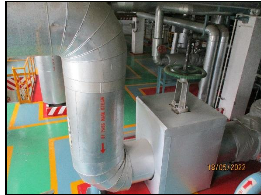
ภาพที่ 2.21 ให้นวนกันความร้อนเครื่องจักรบริเวณโครงการ WHG