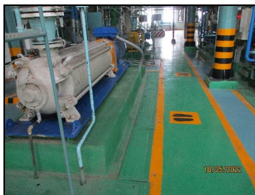
ภาพที่ 2.10 รางระบายน้ำภายในพื้นที่โครงการปรับปรุงและเพิ่มประสิทธิภาพการใช้พลังงานฯ