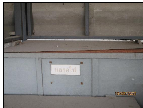
ภาพที่ 2.18 พื้นที่เก็บหลอดไฟที่ใช้งานแล้ว