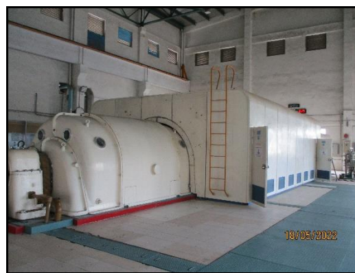
ภาพที่ 2.12 อุปกรณ์ครอบแหล่งกำเนิดที่ก่อให้เกิดเสียงดัง