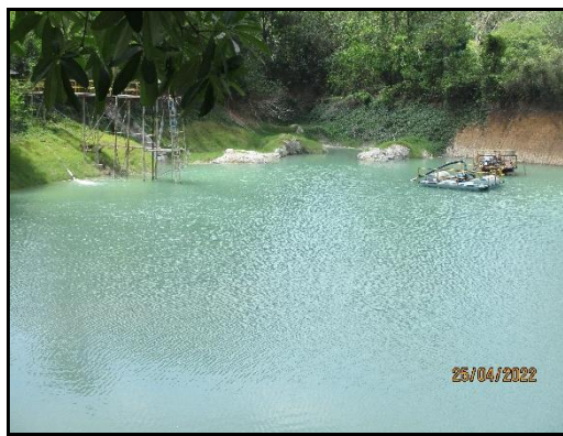
ภาพที่ 2.6 ป่อน้ำ Quarry park ขนาด 100,000 ลบ.ม.