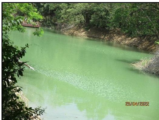
ภาพที่ 2.5 ป่อน้ำหน้าเหมือง ขนาด 80,000 ลบ.ม.