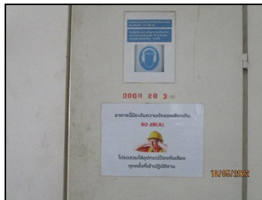
ภาพที่ 2.13 ป้ายเตือนบริเวณที่ต้องสวมใส่อุปกรณ์ป้องกันอันตรายส่วนบุคคล